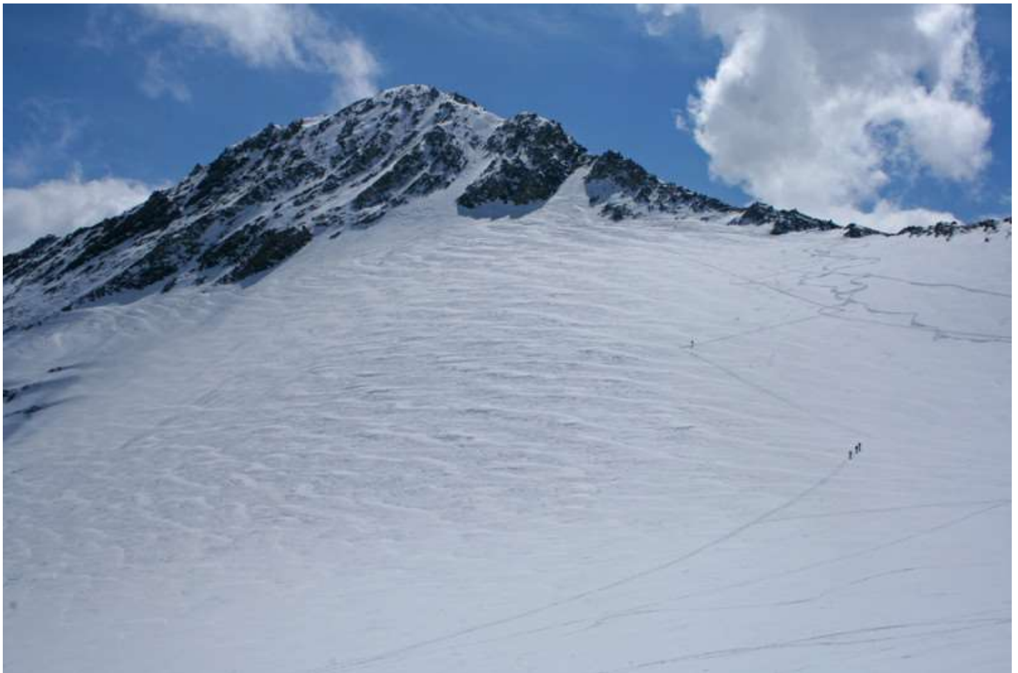
Aiguille du Goléon 3427m – Glacier et sommet

Puis on redescend au parking et retour à Beaune dans la soirée.