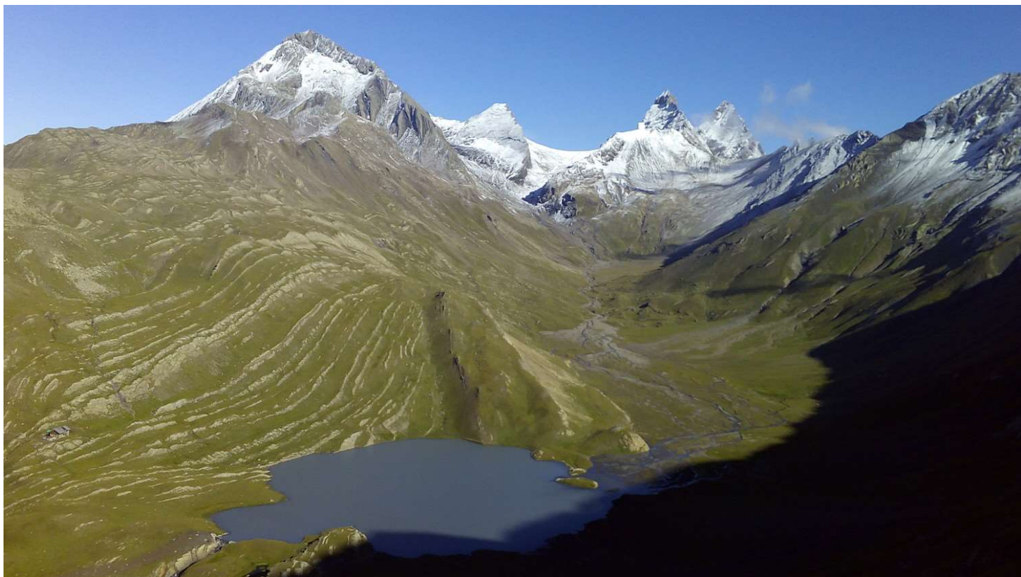
Refuge, lac et Aiguille du Goléon – Aiguille de la Saussaz – Aiguilles d'Arves